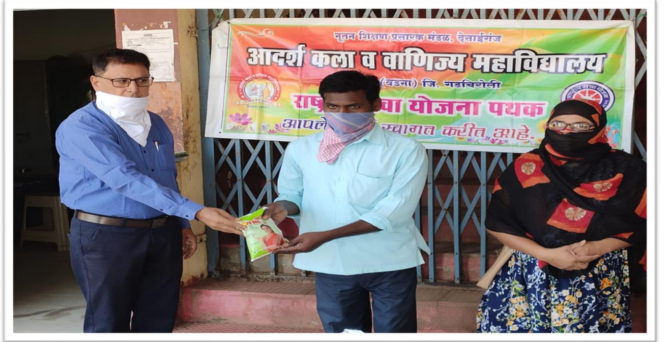
Food kits distribution to Disha Divyang Taluka Sanghathana Members during COVID-19 pandemic lockdown.