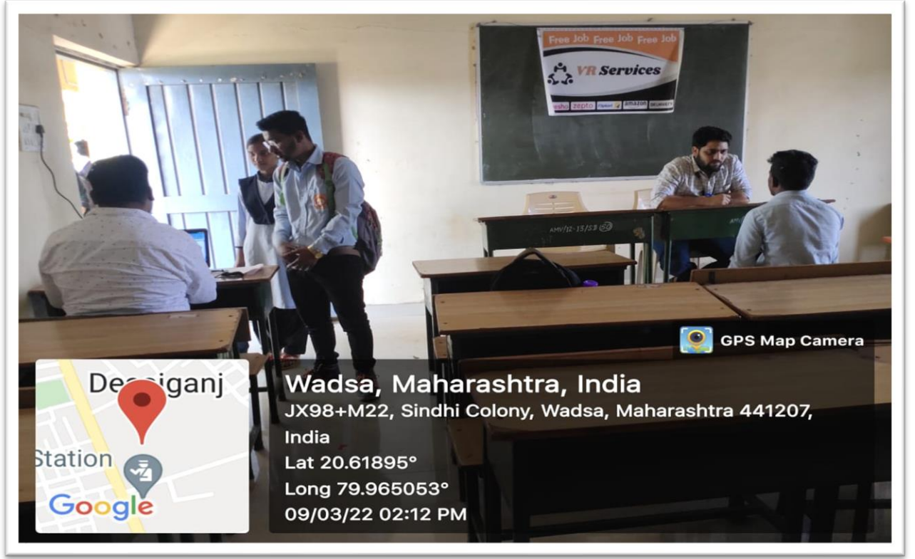
Students' participation in job fair and placement camp