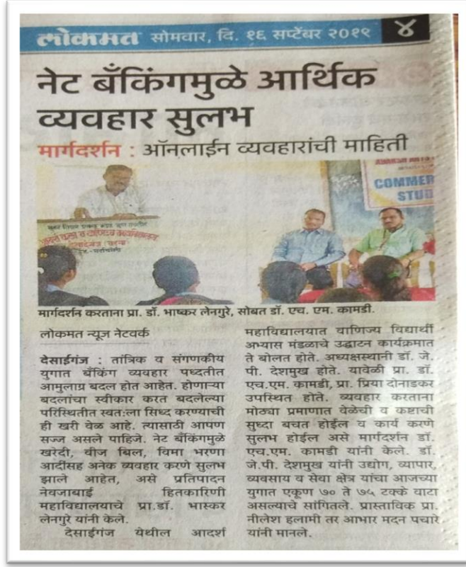
NEWS of the event published in the Newspaper