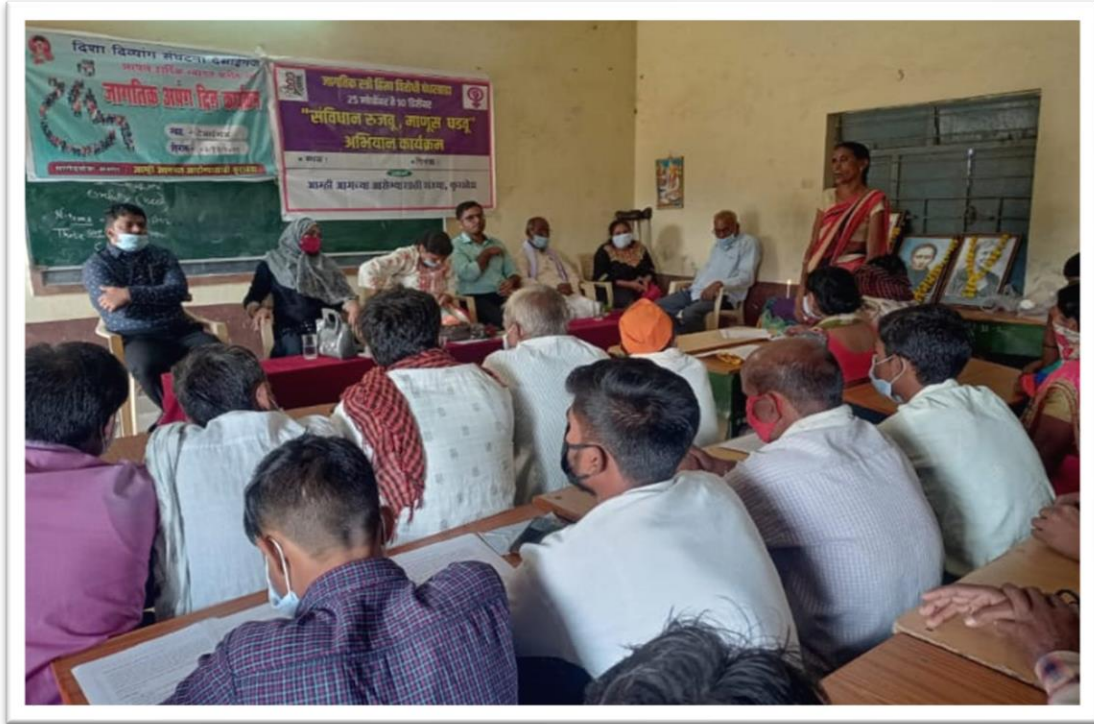
Monthly Gathering of Disha Divyang Sangathana Members, held on 3 rd day of every month organized at the college.