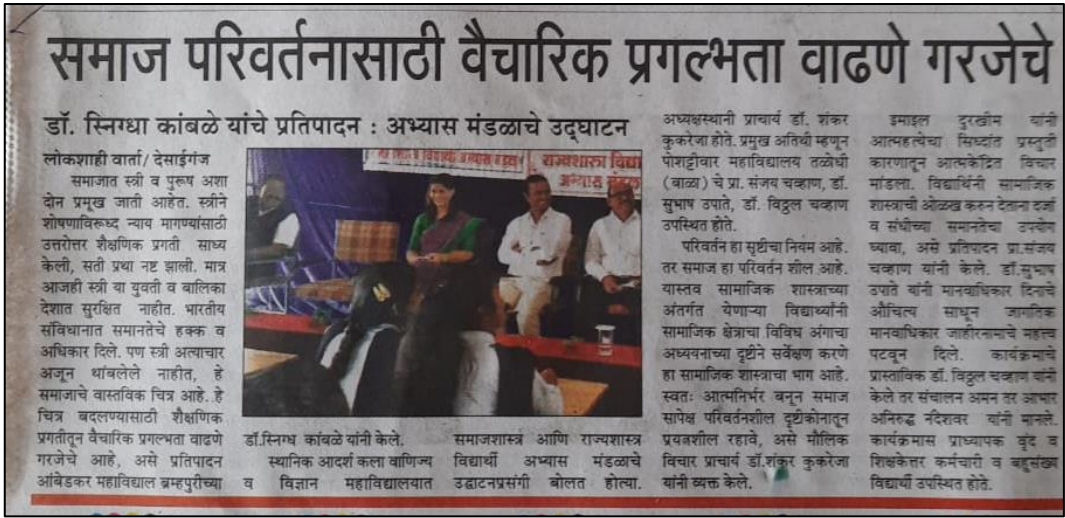
NEWS of the Event published in the Newspaper