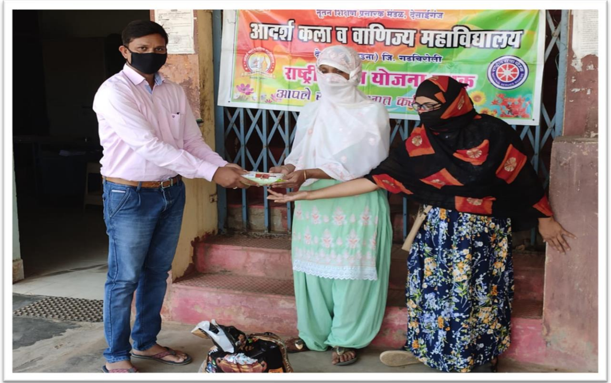
Food kits distribution to Disha Divyang Taluka Sanghathan Members during COVID-19 pandemic lockdown.