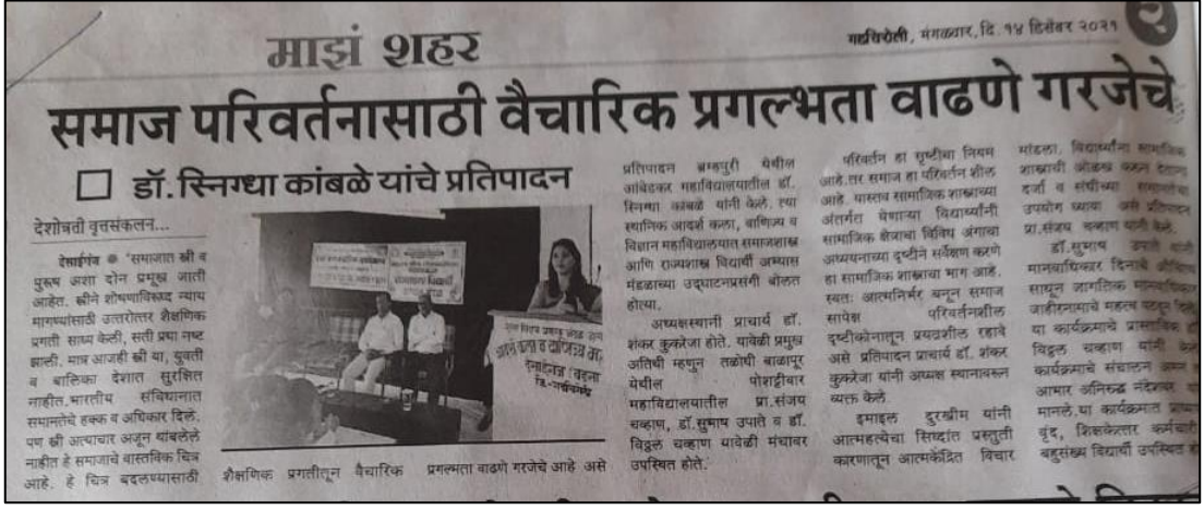
NEWS of the Event published in the Newspaper